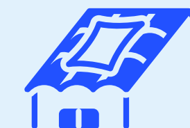
Extérieur pour les pièces robustes

Plus de 1 000 m 2 sont dédiés à la gestion de près de 600 références permanentes, complétées par des flux temporaires. L'ensemble des opérations est organisé selon la méthode FIFO, garantissant une gestion à la fois fluide et rigoureuse des stocks.