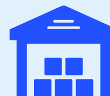
Intérieur pour les produits sensibles