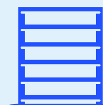
Rack pour les petites pièces

TLR a déployé une solution de stockage mixte :